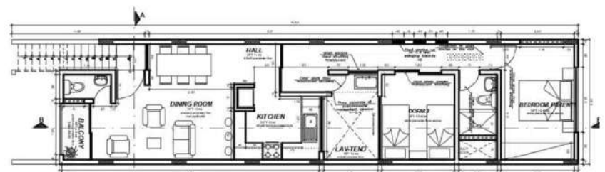
SECOND FLOOR SCALE 1:50

https://www.institutocreativodigital.com/los-estudios/#CPADA30h